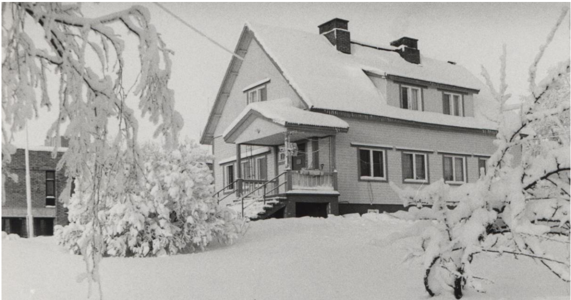
Rääkkylän entinen terveystalo eli nykyinen Nuorisotalo. Kuva on otettu vuonna 1986.

Terveystaloja valmistui vuoden 1955 loppuun mennessä 527. Niiden joukossa Rääkkylänkin terveystalo, tuo nykyinen nuorisotalomme. Ennen vuotta 1947 valmistui 42 terveystaloa. Yleisesti niin Ruotsissa kuin Suomessakin todettiin, että terveystalojen rakentaminen oli näkyvä päätös vuosien kummikuntatyölle. Terveystalojen rakennuskustannusten rahoitus jakaantui eri yhteisöjen välille vuoden 1952 lopussa, jolloin valtaosa terveystaloista oli valmistunut (492), tehdyn selvityksen mukaan: Kunnat 59,5 %, MLL 27,5 %, Valtio 1,2 %, Suomen Huolto ja muut järjestöt 8,2 %.