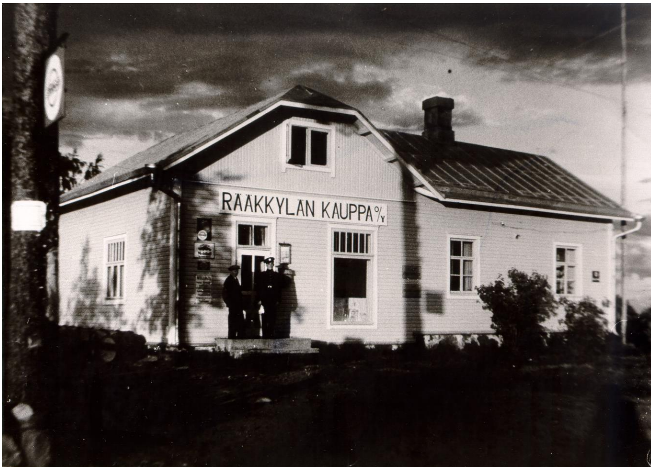
Kompakan myymälä.